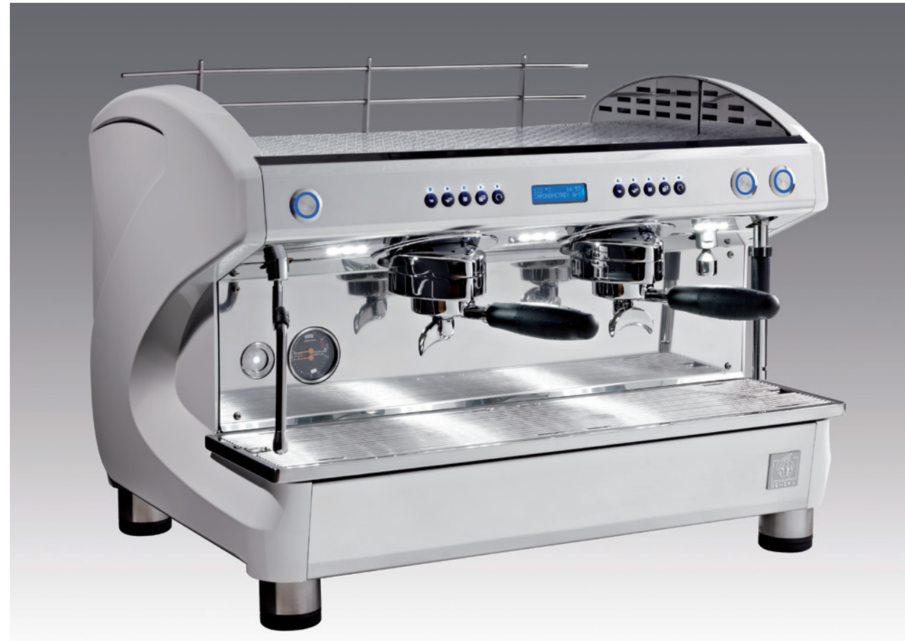
Farben: „Piano“ Schwarz / „Piano“ Weiß – Verfügbar in 1, 2 und 3 Gruppen

Die LIFE & LIFE HIGH CUP Espressomaschinen mit den neusten Technologien, Aroma Perfect, Micro Sieve & MultiCoffee System bieten gleichbleibende perfekte Extraktionsqualität sowie einfachstes Handling bei der Kaffeezubereitung.