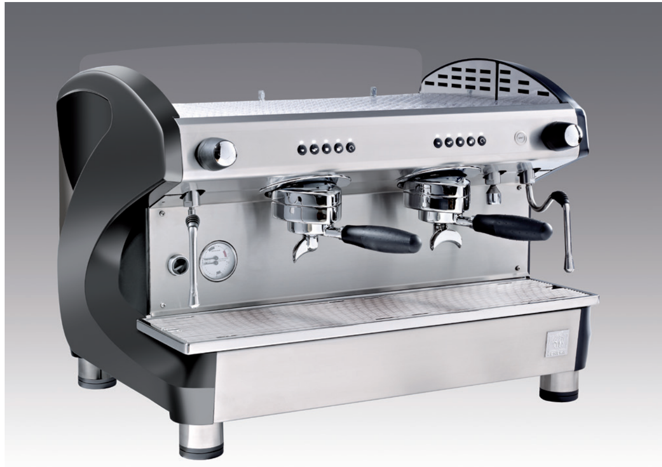
Farben: Dunkelgrau / „Piano“ Schwarz / „Piano“ Weiß – Verfügbar in 1, 2 und 3 Gruppen

Die VIVA-Technologie ergibt für Sie die beste Symbiose zwischen Verarbeitungsqualität, Zuverlässigkeit und Bedienerfreundlichkeit.