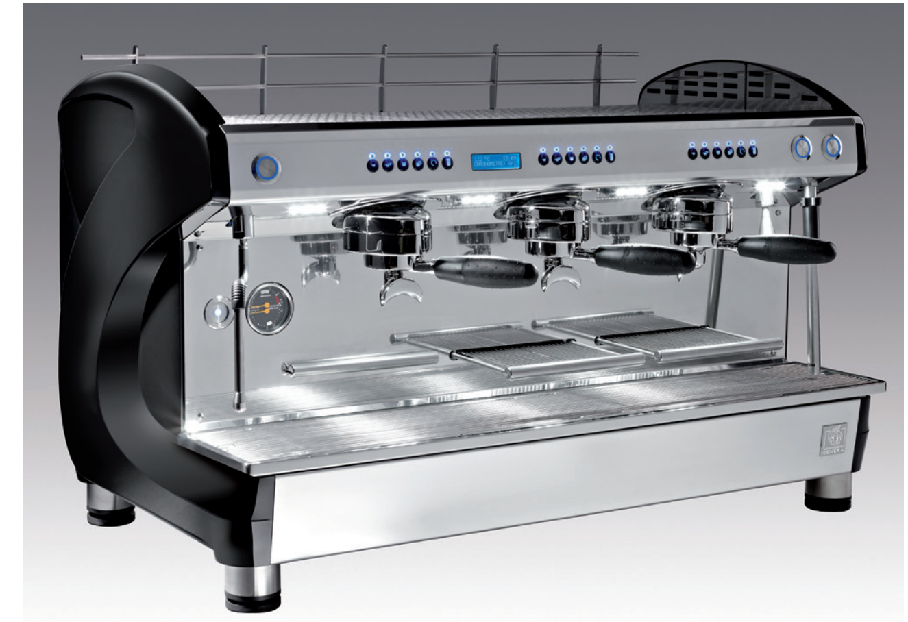
Farben: „Piano“ Schwarz / „Piano“ Weiß – Verfügbar in 2 und 3 Gruppen Ausziehbarer „Tassenabtropfst“, so dass Sie entweder in der Position „hohes Glas“ oder Standardhöhe arbeiten können